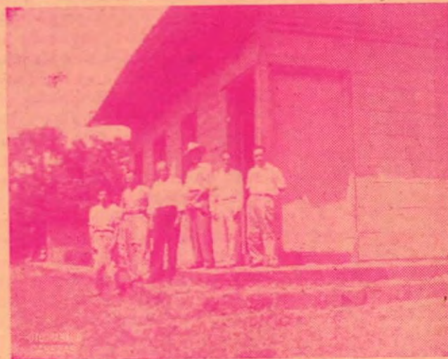
LA JEFATURA POLITICA DE MIRAMAR