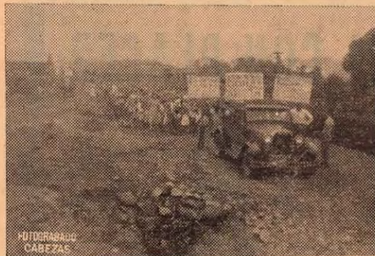
Un desfile escolar en San Isidro del General.

amorató su cuerpo a la sazón casi inerte. Y así fue. Calentó el sol y Domingo Estrada desentumeció y arrastrando, más que caminando, siguió su marcha, casi sin atinar con el rumbo, confiado al acaso, ese diosillo jugueteón y medio duende que gusta hacerle chirigotas a los hombres. Y fue el acaso quien lo puso frente al inmenso valle de El General. —Pasa a la Pág. SIGUIENTE