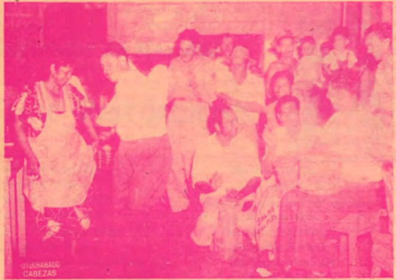
Vecinos de Puerto Jiménez ejecutan una danza típica, el tamborito